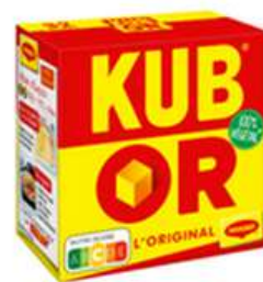
1 cube de bouillon